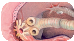
Bandwurm „verankert“ sich in der Darmschleimhaut

Bandwurmbefall kann zu Verdauungsstörungen führen, die mit Verstopfung oder Durchfall einhergehen. Eine verminderte Immunabwehr macht das Tier oft anfällig für andere Erkrankungen.