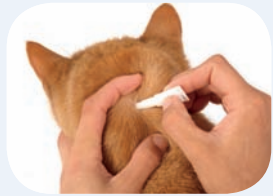
Gesamte Lösung auf die Haut auftragen